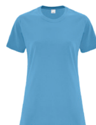
BLEU AQUATIQUE 2389C