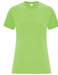
CITRON VERT 367C