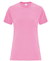
ROSE BONBON 189C