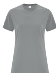
GRIS MEDIUM 423C