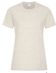
AVOINE CHINÉ*** Warm Grey 2C

*90/10 coton/polyester **50/50 coton/polyester ***98/2 coton/polyester