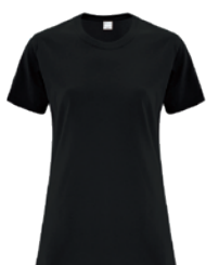
NOIR Black 6C

Les couleurs des tissus sont sujettes à des variations selon les lots et ne correspondront pas exactement aux couleurs de référence Pantone