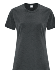
GRIS FONCÉ CHINÉ** 7540C