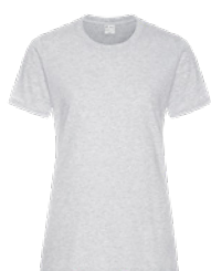
GRIS CENDRÉ*** Cool Grey 3C