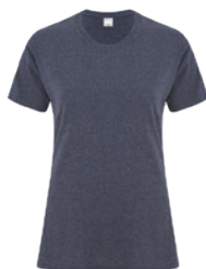
MARINE CHINÉ** 2379C