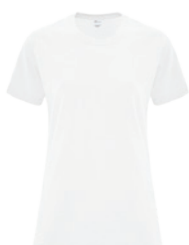
BLANC Aucun PMS