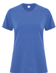
ROYAL CHINÉ** 2130C