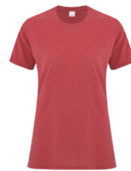
ROUGE CHINÉ** 193C