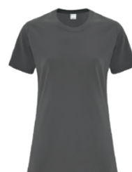
CHARBON Cool Gray 11C