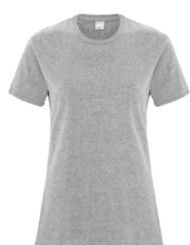
CHINÉ ATHLÉTIQUE* Cool Grey 5C