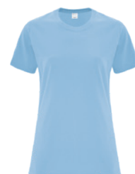
BLEU PÂLE 278C