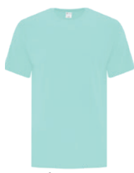
CÉLADON FRANC 7464C