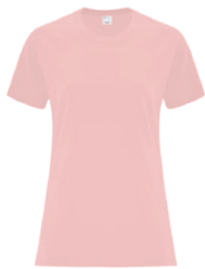
FARD ROSÉ 5025C