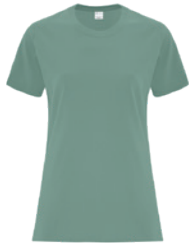
VERT LAUREL 4198C